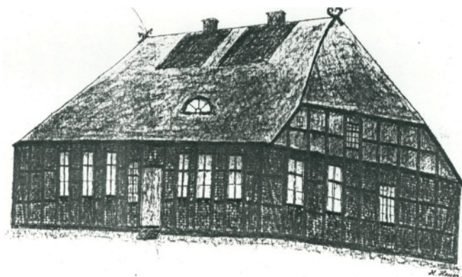
Skizze ca. 1880